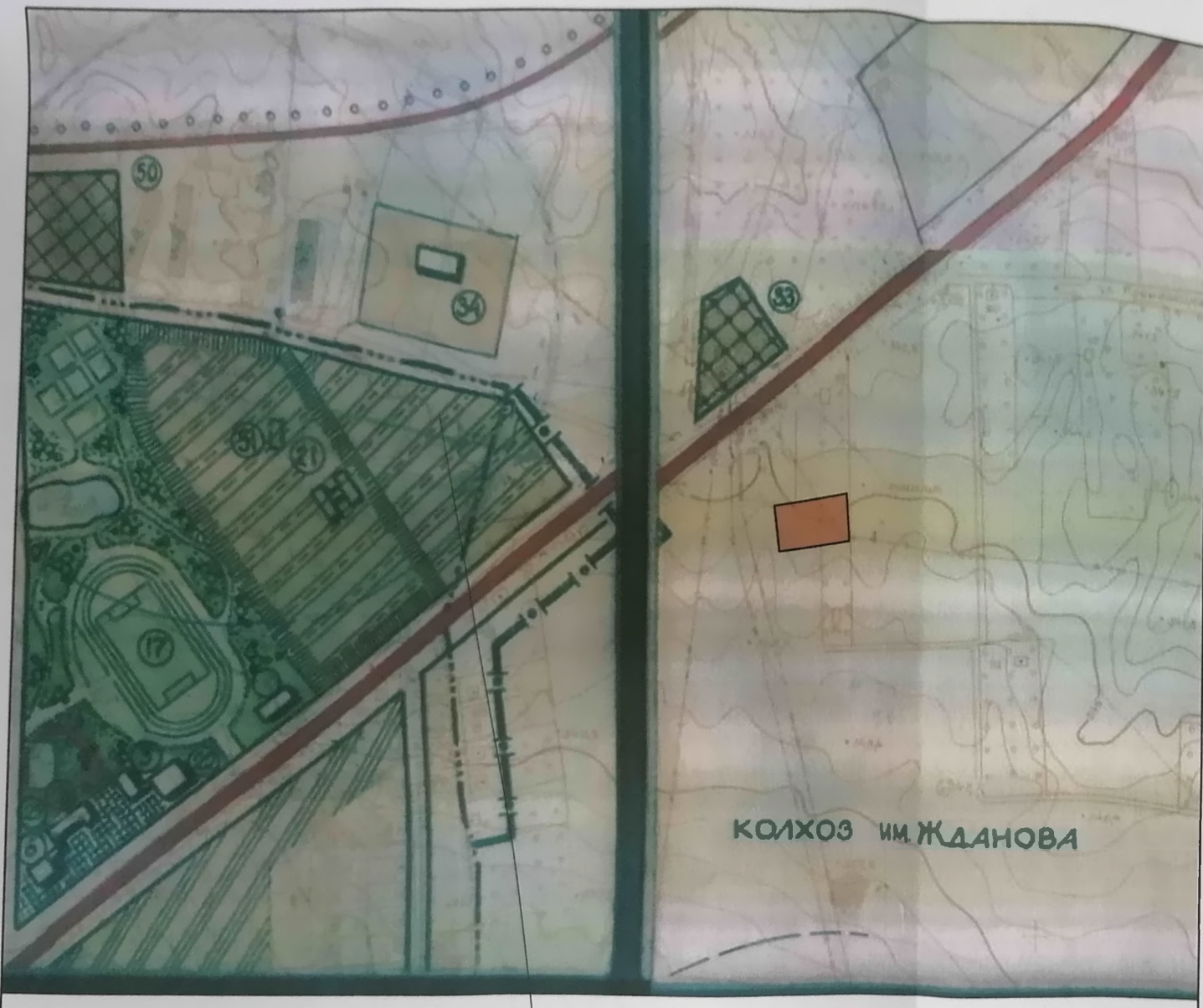
Схема розташування території у планувальній структурі м.Почаїв (фрагмент генерального плану) М 1:5000